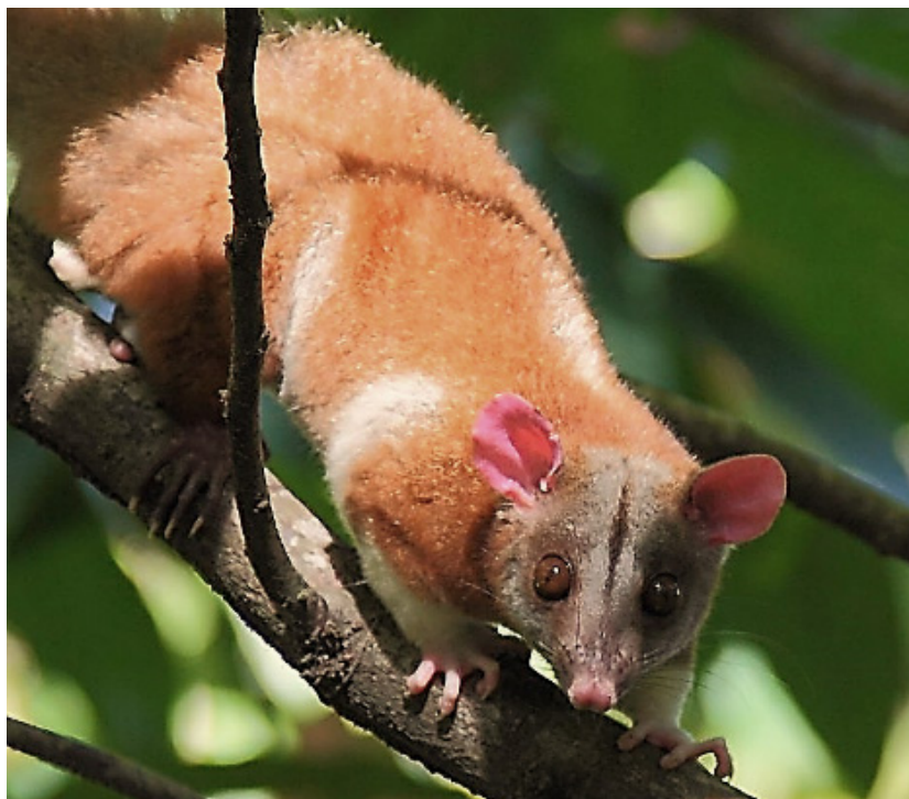
Figura 4. Caluromys derbianus tomado en Río Santiago, sector norte del Parque Nacional Pico Bonito. Foto de James Adams en 2014.

fue captado cuando este individuo había ocupado como propia una plataforma para observadores de aves, instalada a 15 m de altura dentro del bosque. El registro de Bertín Lazo, en Protección (Santa Bárbara), fue el de un macho que estaba dentro del hueco de un tronco al momento de podar árboles para el mantenimiento de una servidumbre eléctrica.