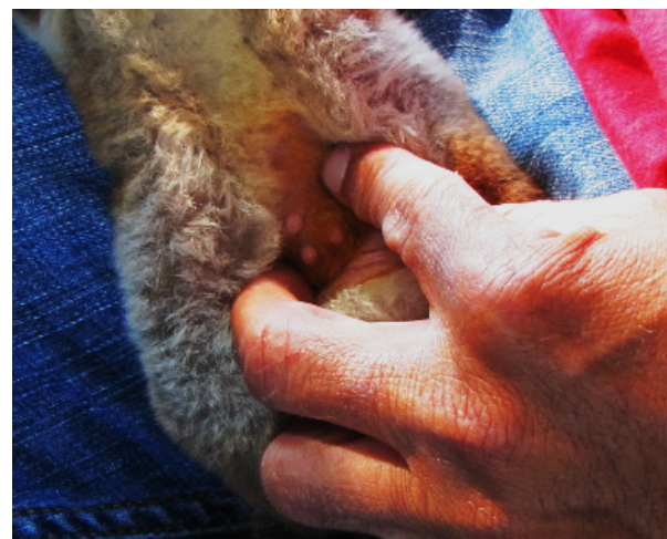
Figura 3. Hembra no lactante de C. derbianus . Foto tomada en UNA-G, Catacamas por Bayardo Alemán.

de una hembra mostrando los tres pezones ventrales no lactantes (Figura 3).