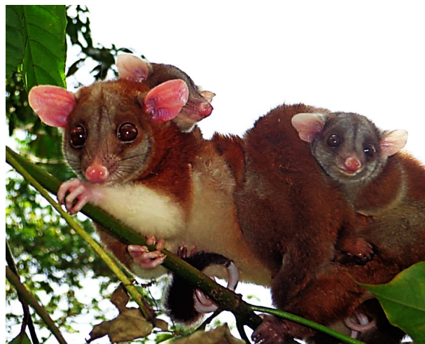
Figura 2. Madre y tres crías encontradas en Aldea La Fe, municipio de Peña Blanca, Cortés, en junio de 2013.