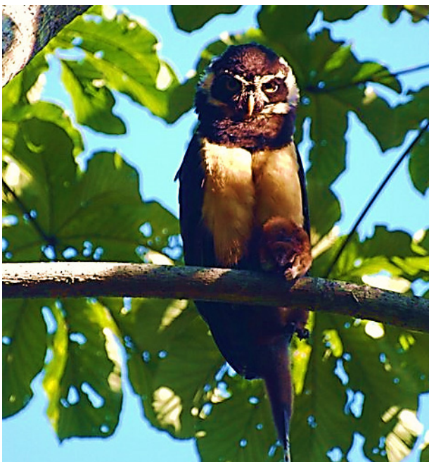
Figura 1. Un búho Pulsatrix perspicillata depredando a un Caluromys derbianus en el Parque Nacional Pico Bonito.

tomada en las inmediaciones del hotel Pico Bonito Lodge (Parque Nacional Pico Bonito, cordillera de Nombre de Dios) en el Caribe de Honduras, donde se aprecia a un búho Pulsatrix perspicillata depredando a un C. derbianus en plena mañana (Figura 1). En la revisión de la dieta confirmada de esta rapaz nocturna, se han documentado presas grandes y medianas incluyendo zarigüeyas (Gómez de Silva et al. 1997); sin embargo, este es el primer registro documentado de depredación de este búho sobre C. derbianus .