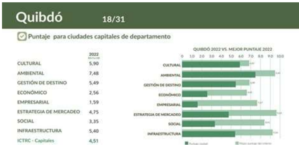
Ilustración 3 . Resultados del Índice de competitividad turística de Quibdó, 2022